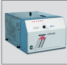
Universalrüttler UVR-300 zur vollautomatischen Bolzenzu- führung