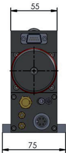
Ansicht von oben | View from above

Technische Änderungen vorbehalten | Technical specifications are subject to change without notice