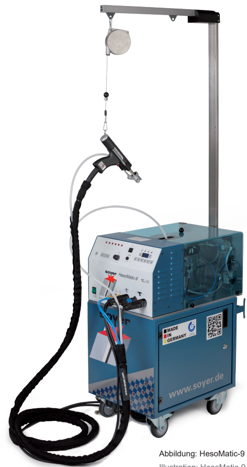
Abbildung: HesoMatic-9 Illustration: HesoMatic-9

Three-in-one: HesoMatic-9 replaces up to three units.