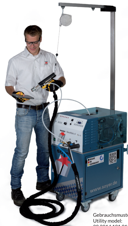
Gebrauchsmuster Utility model: 20 2014 101 013.0