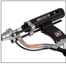
PH-2W mit verstärkter außenliegender Kabelführung PH-2W welding gun with a reinforced cable conduit