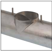
Anwendungsbeispiel Anlagenbau Example of use Plant construction